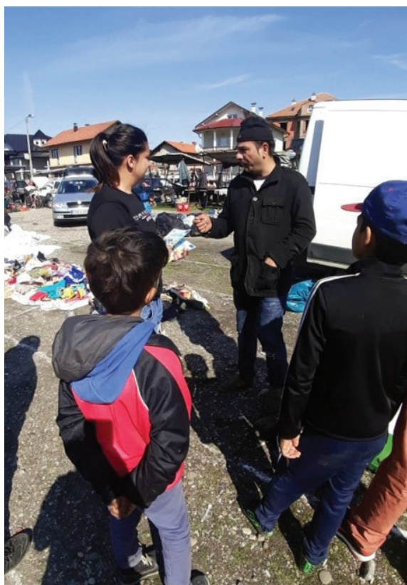
Promocija projekata i usluga DC-a, romska pijaca u Bijeljini, mart 2020.

Rad na terenu je jedna od prvih i najvažnijih aktivnosti našeg udruženja, i obuhvaćena je svim projektima. Podrazumijeva konstantnu komunikaciju sa korisnicima na terenu i asistenciju u svim poljima, kada je riječ o ostvarivanju prava.