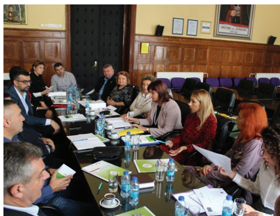
Sastanak Radne grupe povodom obilježavanja Evropskog dana borbe protiv trgovine ljudima, Velika sala Gradske uprave Grada Bijeljina, oktobar 2019.

Glavni cilj radnih grupa je zaštita djece, primjena i poštovanje Konvencije UN-a o pravima djeteta (CRC) u skladu sa Univerzalnim indikatorima za dobrobit djece iz područja bezbjednosti, zdravlja, postignute njege i uključenosti, u skladu sa Zakonom o socijalnoj zaštiti Republike Srpske, Zakonom o dječijoj zaštiti, Zakonom o zaštiti i postupanju sa djecom i maloljetnicima u krivičnom postupku Republike Srpske, Zakonom o zaštiti ličnih podataka BiH i ostalih zakona i podzakonskih akata koji su relevantni za konkretnu materiju.