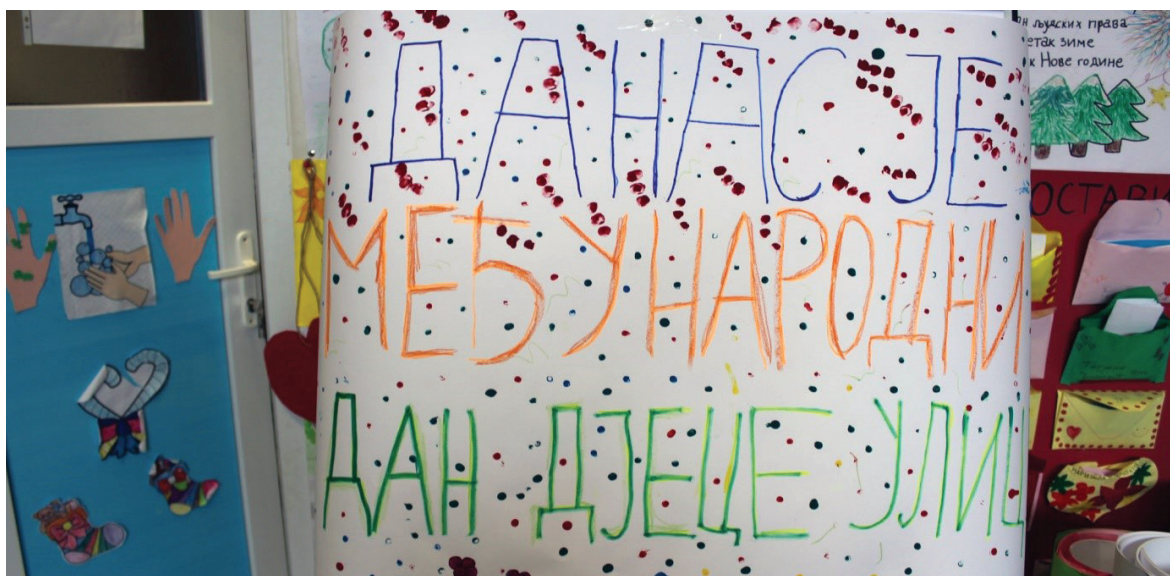
Obilježavanje Međunarodnog dana djece ulice u Dnevnom centru, april 2019.