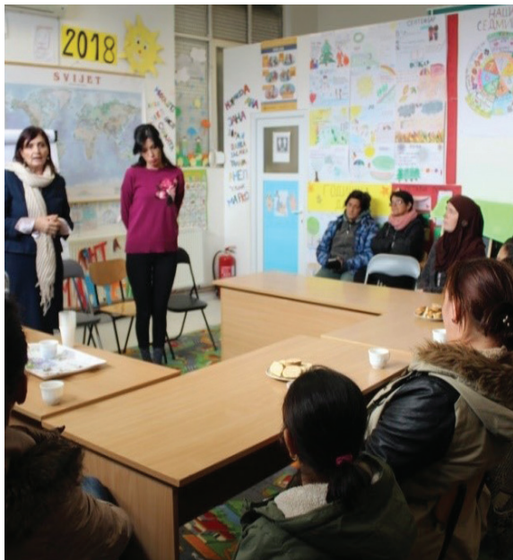
Radionica sa roditeljima na kojoj je gostovala zamjenica Omuđmana za djecu RS, prostorije DC-a, decembar 2018.

Teme koje se obrađuju sa roditeljima su: „Uloga roditelja u svim aspektima razvoja djeteta“, „Pozitivno roditeljstvo“, „Osnaživanje roditelja“, „Uspostavljanje pozitivne dinamike među roditeljima“.