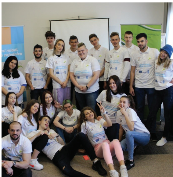
Vršnjačka edukacija za volontere Senata mladih „OMOTE“ u Hotelu „River“, februar 2020.

U sklopu UG „Otaharin“ djeluje i Senat mladih „OMOTE“, koji je dostupan svim mladim ljudima koji žele da se bave društveno korisnim radom. Osobe koje dođu da se učlane u LVS obavljaju razgovor sa koordinatorom LVS-a i popunjavaju upitnik. Ukoliko pokažu interesovanje za volontiranje u Dnevnom centru, dolaze na razgovor sa stručnim osobljem. Od procjene stručnog osoblja zavisi njihov dalji angažman. Ova procjena se odvija konstantno, dokle god je neki volonter u Dnevnom centru.