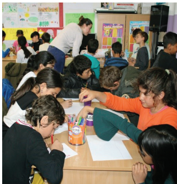
Radionice sa djecom u prostorijama DC-a, 2019/2020.