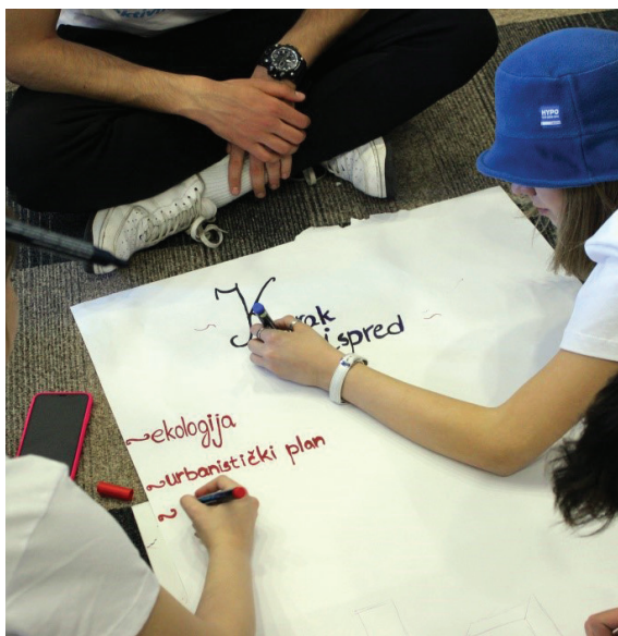
Vršnjačka edukacija za volontere Senata mladih „OMOTE“ u Hotelu „River“, februar 2020.

mjesečno održavaju radionice za djecu mlađeg uzrasta o temama od značaja.