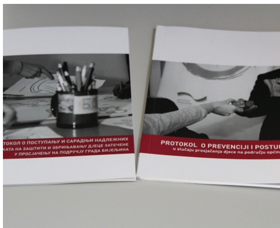
Protokoli o postupanju u slučajevim prosjačenja, Bijeljina i Živinice, april 2018.

Ovim mehanizmom osiguravamo da sva djeca uživaju svoja prava, a nadležni i roditelji imaju određene obaveze koje imaju za cilj nesmetano ostvarivanja tih prava.